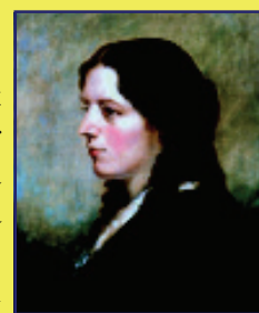
Harriet Becket Stowe 1811-1896

Cu secole înainte, regele Solomon a vorbit despre puterea de schimbare pe care o putea face „busola morală” în poporul lui Dumnezeu, Israel. Era nevoie ca ei să se smerească și să-și mărturisească păcatele. Domnul i-a spus lui Solomon: „ Dacă poporul Meu peste care este chemat Numele Meu se va smeri, se va ruga și va căuta Fața Mea și se va abate de la căile lui rele, îl voi asculta din ceruri, îi voi ierta păcatul și-i voi tămădui țara ” (2 Cron. 7.14).