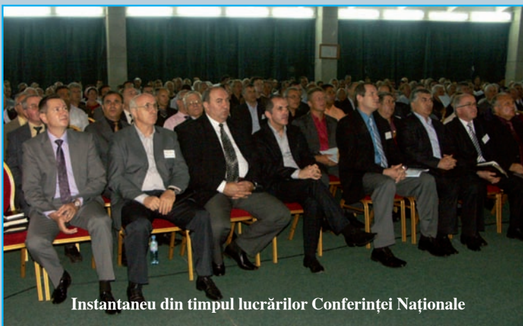
Instantaneu din timpul lucrărilor Conferinței Naționale

„Aduceți-vă aminte de mai marii voștri, care v-au vestit Cuvântul lui Dumnezeu; uitați-vă cu băgare de seamă la sfârșitul felului lor de viață, și urmați-le credința!” Evrei 13:7